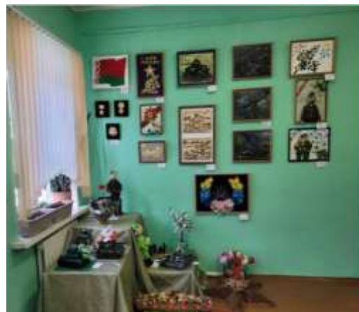
Фото 2. Выставка детского творчества «Нам мир завещано беречь»

В номинации «Арт-объект» (Фото 4) учащиеся выполнили творческие работы для интерьера из различных материалов и в различных техниках декоративно-прикладного творчества на темы: «Военная техника», «Реконструкция сцен боя», «Партизанское движение Докшичины», «Герои войны», «Памятники героям – освободителям». Своё видение тем «Дорогами войны», «Весна памяти», «Докшичина – от истоков в будущее», «Символы моей страны» выразили в декоративных панно.