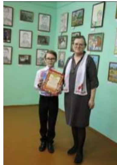
Фото 1,2 Награждение победителей и призёров конкурсов