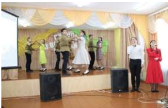
ГУО «Порплиценская СШ»