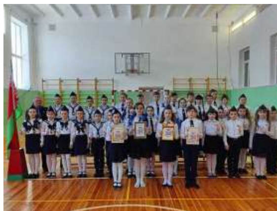
Подведение итогов районного конкурса «Смотр строя и песни»

Одним из ярких и запоминающихся мероприятий, проходивших в рамках проекта «Храним в сердцах и память, и Великую Победу», стал районный конкурс «Смотр строя и песни», который стал не только проверкой строевой подготовки, исполнения строевой песни в движении, но и коллективизма, сплочённости отрядов. Участники смотра-конкурса строевым шагом и выправкой показали, что они верны традициям прадедов, подарившим нам Великую Победу и шагнувших в бессмертие. В конкурсе приняли участие 108 человек из 10 учреждений образования Докшицкого района. Лучшими в каждой из трёх возрастных групп стали команда «Докшицкие моряки» ГУО «Средняя школа №2 г.Докшицы», команда «Боевые подруги» ГУО «Крулевщинская средняя школа имени И.Ф.Титкова» и команда «Докшицкий десант» ГУО «Средняя школа №1 г.Докшицы».