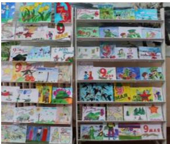
Фото 1. Выставка детского рисунка «Нам мир завещано беречь»

Районный конкурс детского творчества «Нам мир завещано беречь» (Фото 1, 2) был посвящён 77-й годовщине Победы в Великой Отечественной войне и Году исторической памяти. Партнёрами конкурса стал районный совет Белорусского общественного объединения ветеранов, который принимал участие в определении тем конкурсных работ.