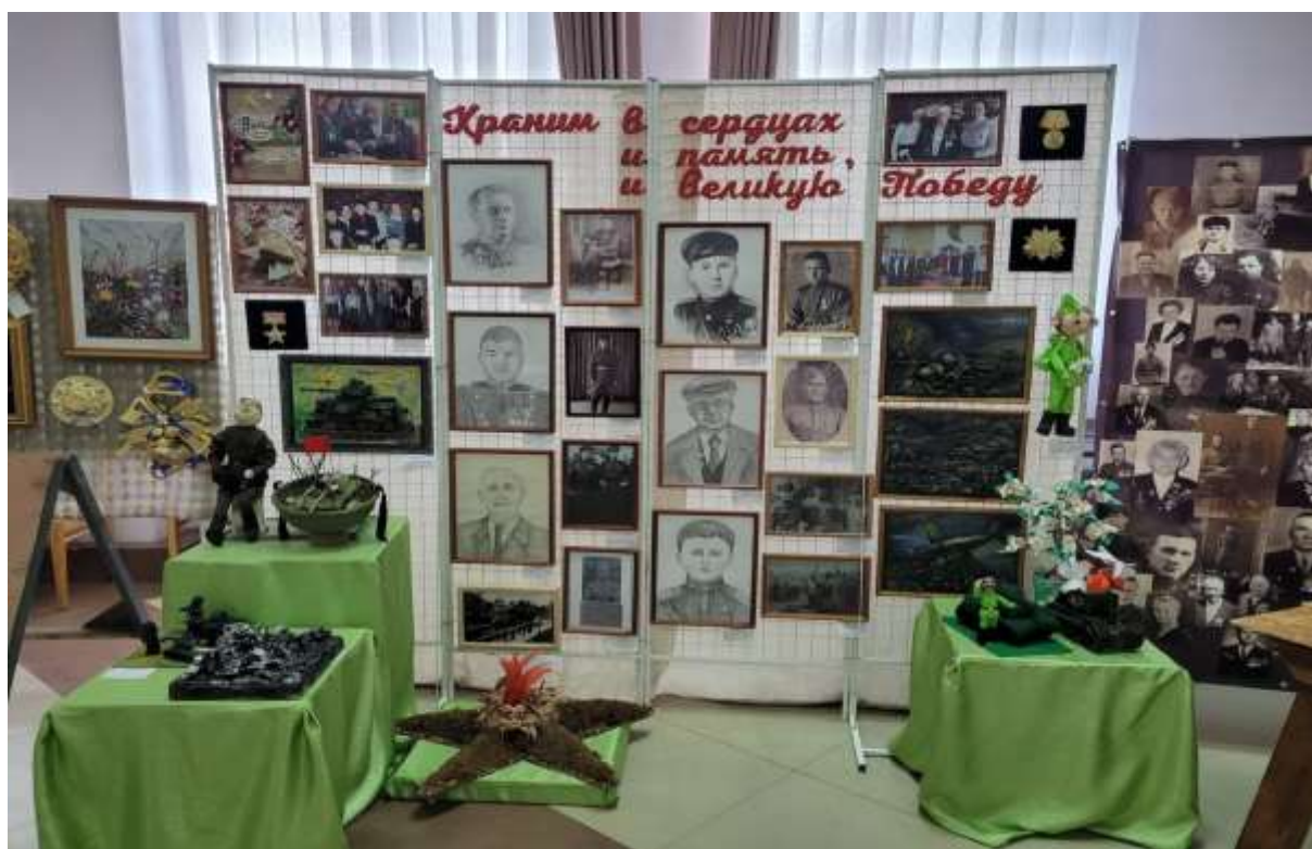
Фото 1. Передвижная выставка в киноконцертном зале «Искра»