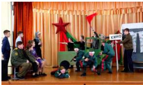
«СШ № 1г. Докшицы»