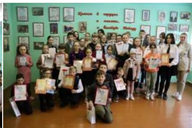
Фото 3,4. Презентация выставки «Храним в сердцах и память, и Великую Победу»

Творческие работы выставки после завершения проекта также представлялись в формате передвижных выставок на городских праздниках, посвящённых Дню Победы, Дню Независимости Республики Беларусь. Этот вид выставочной деятельности играет большую роль в стимулировании их дальнейшей творческой деятельности, является пропагандой детского творчества. Также выставочная деятельность – это отличный способ привлечь внимание большого количества детей к таким важным темам, как