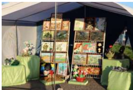
Фото 1. Передвижная выставка на городском празднике, посвящённом Дню Победы

Великая Отечественная война. А понимание того, что их работы видят жители и гости города, поднимает у детей самооценку и создаёт ситуацию успеха, способствует осознанию значимости своего вклада в сохранение памяти о героическом подвиге белорусского народа, усвоению ими ценностей, идеалов гражданина и патриота.