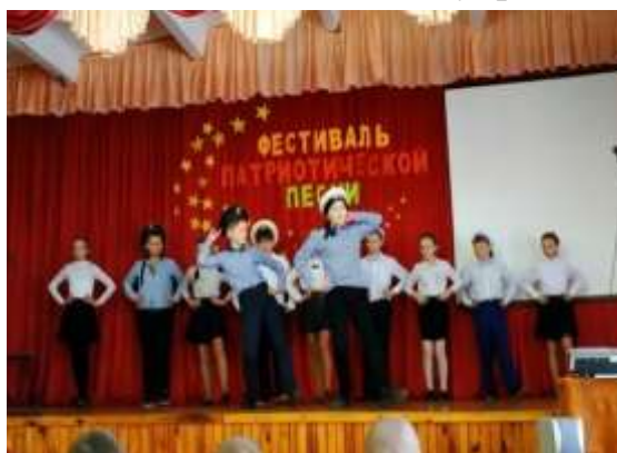
ГУО «Крулевицкая СШ»